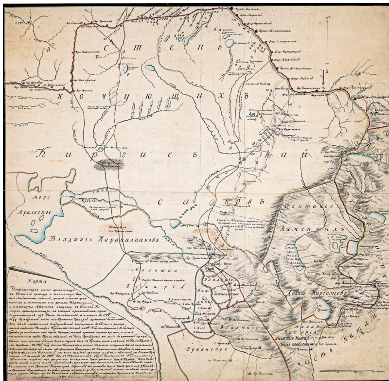
Рисунок 3 – Фрагмент карты М.С. Пospelова 1800 г.

оседлое поселение с базаром обозначали словом кент (Халид, 1992:240). Таким образом, содержание географического названия «Житы Кент» означает буквально «семь городов» или «семь селений». Топоним мог передавать понятие «много городов». В словаре Е. Койчубаева приводится целый ряд топонимов, в которых «жеты» не указывает на конкретное число, а показывает множественность географических объектов: Жетижар – «много оврагов», Жетикара – «много холмов», Жетиколь – «много озер» (Койчубаев, 974:101–102). Примеры нечислового обозначения слова «жеты» у многих народов Евразии приведены в работе М. Семби о топониме Жетысу (32, С. 151–165). На наш взгляд, схожую этимологию с Жетыкентом имеет название урочища Джетыасар в Кызылординской области РК буквально означает «семь крепостей – асаров» (Семби, 2013:287). Скорее всего, также показывает множественность «крепостей – асаров». Наличие древних укреплений – главное в ландшафте данного района, расположенного в обширнейшей пустынной равнине. Все городища расположены группами по 5–7 (до 10) крепостей, общее количество превышает более полусотни (Левина, 1996:9–12).