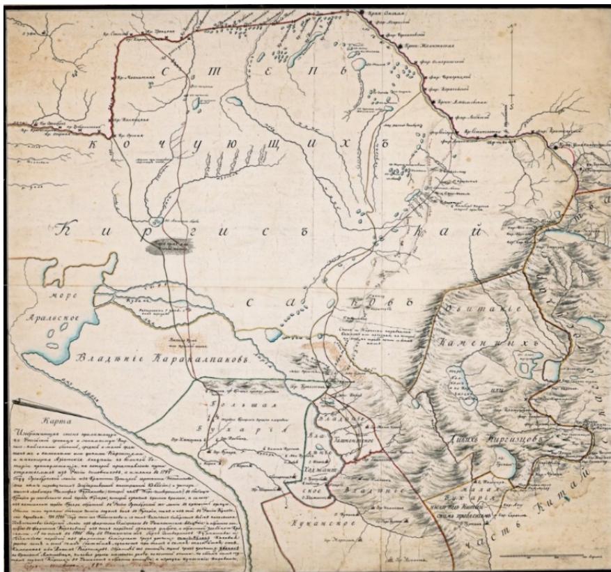
Рисунок 1 – Карта М.Пospelова.1800 г.

1800 г. в междуречье Арысь-Бадам населенного пункта с надписью «гор. Житы Кент» (Рис. 1, 3) Судя по карте он располагался вблизи обозначенного пунктиром маршрута путешествия М. Пospelова и Т. Бурнашева (1800 г.) и поэтому нет оснований подвергать сомнению достоверность локализации указанного топонима. При составлении карты М. Пospelов в первую очередь пользовался собранными им самим во время путешествия материалами. Как известно поездка М. Пospelова и Т. Бурнашева в 1800 г. в Ташкент дала новые сведения о Южном Казахстане и соседних с ним районах Средней Азии (Маслова, 1955:28–29; 12). И появление нового, ранее не обозначавшегося на картах топонима отражает новые данные, полученные в ходе экспедиции 1800 г.